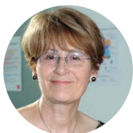
Françoise Descamps-Crosnier, Présidente du Comité national du FIPHFP