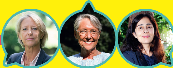
SOPHIE CLUZEL, SECRÉTAIRE D'ÉTAT AUPRÈS DU PREMIER MINISTRE, CHARGÉE DES PERSONNES HANDICAPÉES