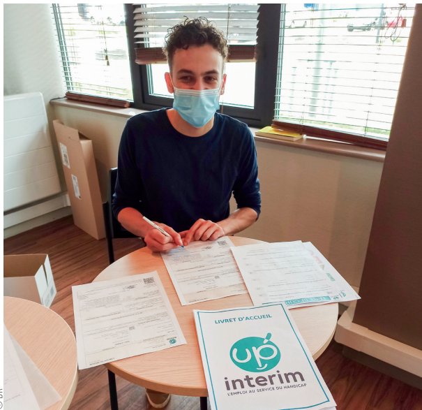
Un jeune candidat signe son contrat d'intérim chez Up'Intérim à Brest.