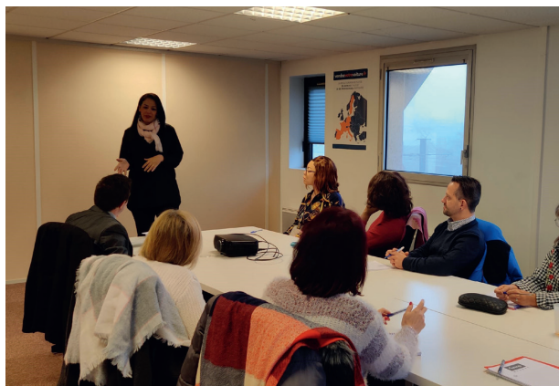
Une session de recrutement organisée par l'entreprise adaptée de l'ANRH-Rouen à Saint-Etienne-du-Rouvray.