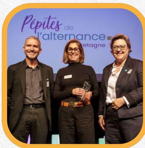
LFP prix coup de cœur