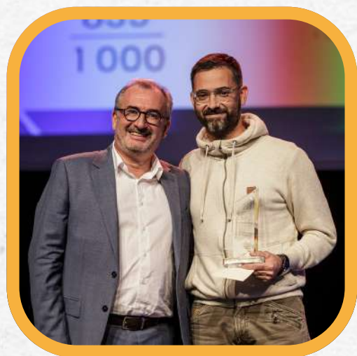
Golfe Agencement moins de 20 salariés