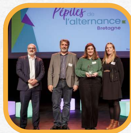
STEF plus de 250 salariés